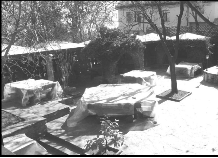
Resim 12: Mevlevihanenin arka bahçesi.

dan bir kapıyla arka bahçeye çıkılmaktadır. (Resim 12) Geçmişte derviş odaları olarak kullanılan hücreler, bu bahçeye açılmaktadır. Bu bahçe tarafından derviş hücrelerinin alt kısmında eski kale duvarı görünmektedir. (Resim:13) Bu duvar Mevlevîhane'nin altından geçmektedir. Ayrıca ön tarafta başka bir bahçe daha bulunmaktadır.