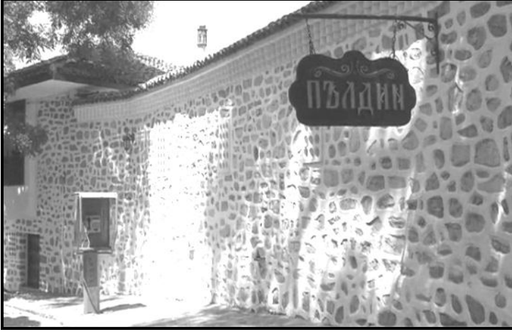
Resim 2: Filibe Mevlevihanesinin girişinde Mevlevihane yazısı.