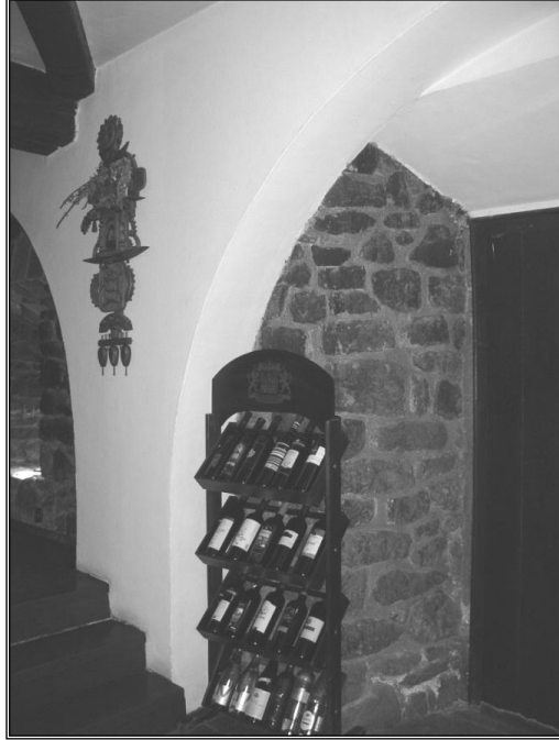
Resim 11: Alt katta Meyhaneye dönüştürülen bölüm.

Bu kısmın altında depo olarak kullanılan bölümler vardır. Bu alt kısmın dekorasyonu klasik Bulgar meyhanesine benzetilmiştir. (Resim 11) Bu kısım-