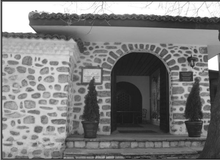
Resim 1: Filibe Mevlevihanesinin girişi.

Mevlevihane'nin yapılış tarihi hakkında bir kaç görüş bulunmaktadır. Bulgar kaynaklı eserlerde yapılış tarihi olarak 1553 tarihi verilirken, 47 Türk kaynaklarında bu tarih XVII. Yüzyılın sonu olarak gösterilmektedir. 48 Bu ihtilafın sebebi olarak şu sebepler gösterilebilir: İtalyan gezgin Veranti Buda'dan Adrianopola adlı eserde 1553 yılında Filibe'yi ziyaretinden bahsederken burada bir Mevlevihane olduğundan bahsetmektedir. 49 Evliya Çelebi ise Seyahatnamesinde Filibe'den geçiş tarihi olarak 1652 yılını vermiş ve burada Mevlevihane olmadığını bildirmiştir. 50 (Resim:1,2) Machiel Kiel Filibe kaleme aldığı ansiklopedi maddesinde Mevlevihane'nin kuruluş serüveninden şöyle bahseder: "Macaristanın Peç bölgesinin Avusturyalıların eline geçmesiyle beraber Filibe'ye gelen Müslüman göçmenlerin, XVII. Yüzyılın sonunda burada bir Mevlevihane kurmuşlardır. 51 Başbakanlık arşivinde Ali Emiri III Sultan Ahmet kütüğünde 1141 tarihiyle kayıtlıdır. 52 Bu bilgiler dışında Mevlevihanenin yapılışı ile ilgili elimizde başka bilgiler mevcut değildir. Bir zamanlar Mevlevihane, Camii, imaret, derviş hücreleri ve medrese olarak büyük bir eğitim ve dini mekân olarak kullanılmaktaydı. 53