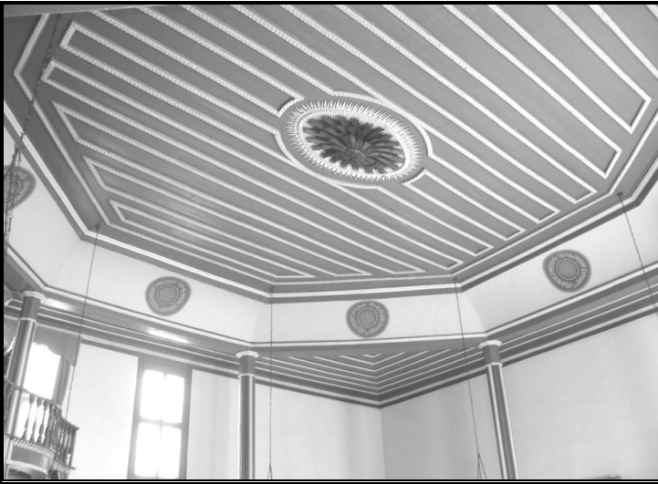
Resim 9: Semâhane ve tavan süslemeleri.