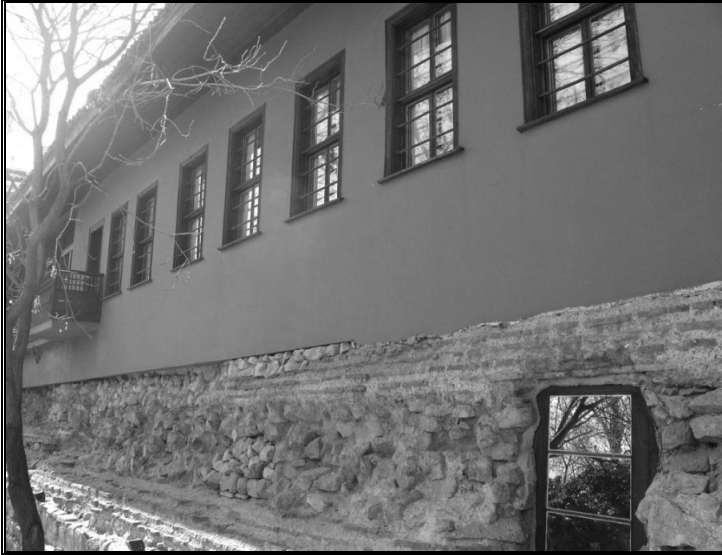
Resim 13: Derviş odaları ve kale duvarının görüntüsü.