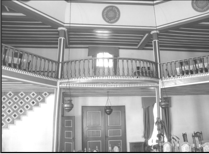
Resim 8: Mutribân mahfili.

Salonun üst kısmında mutribân'ın kullandığı sermahfil bulunmaktadır. Mevlevîhane semâhânesi ve mutribân mahfili sağlamdır. Aslına uygun şekilde restore edilmiştir. 14x16 kareye benzerdir. Düz tavanı sekiz ahşap sütun taşımaktadır. Eski dönemlere ait şamdanlar muhafaza edilmiştir. Selamlık ve Semâhane bölümlerinde XIX. Yüzyılın barok süsleme özellikleri dikkat çekmektedir. Tavan, duvar ve sütun süslemeleri yenilenmiş ve bir canlılık kazandırılmıştır. Tavanda ortada bir güneş, kenarlarda ise bazı ayetler bulunmaktadır.(Resim 8-9)