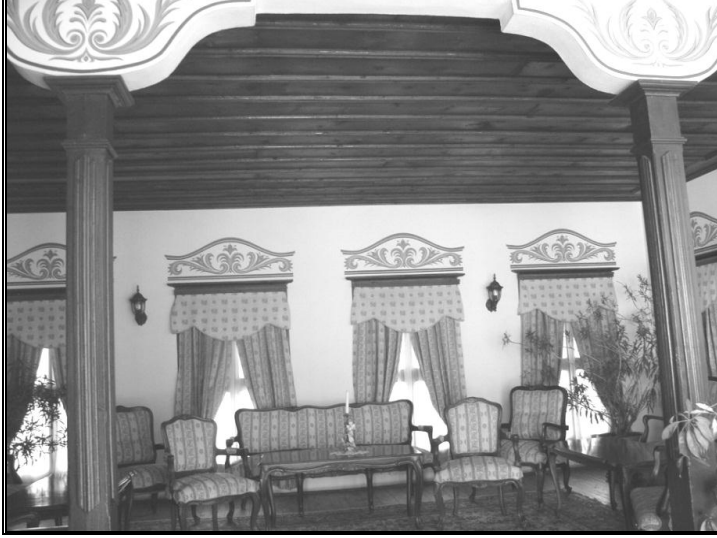
Resim 6: Mevlevîhanenin Derviş Hücreleri. (Misafirhane olarak kullanılıyor)

Bir iç bahçe görünümünde olan buranın orta kısmında ise su ihtiyacının karşılandığı bir kuyu bulunmaktadır. (Resim 5) bahçenin yan tarafında şu anda misafirhane olarak kullanılan derviş hücreleri bulunmaktadır. Hücrelerin ara duvarları yıkılmış ve geniş bir salon olarak hizmet vermektedir. (Resim 6)