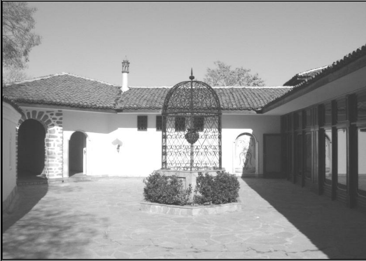
Resim 5: Mevlevîhanenin bahçesi ve ortasında kuyusu.