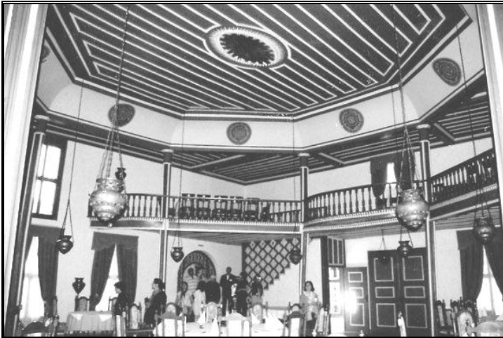
Resim 7: Filibe Mevlevîhanesinin Sema Salonu (Şimdilerde yemek salonu)

Oradan uzun bir koridordan geçildikten sonra şimdilerde yemek salonu olarak kullanılan semâhaneye ulaşılmaktadır. Bugün Mevlevîhane'nin ayakta kalan ve orijinalliğine uygun şekilde restore edilen tek kısım bu semâ salonudur. Burası restoranın yemek salonu olarak kullanılmaktadır. (Resim 7)