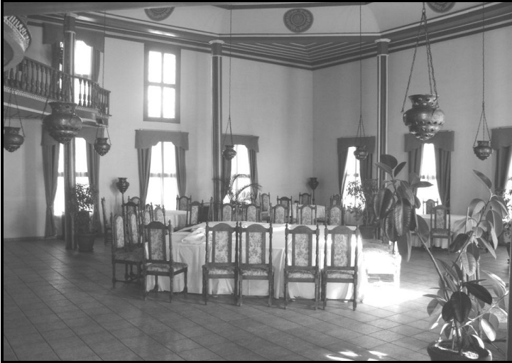
Resim 3: Filibe Mevlevihanesinin Sema Salonu

XIX. yüzyılın sonlarında Mevlevihane terk edilmiştir. 54 Daha önce de belirtildiği gibi Filibe'de bulunan birçok Osmanlı mimari eserleri yıkılmış veya deprem bahane edilerek tahrip edilmiştir. Bu yıkım politikasından Mevlevihane de nasibini almıştır. Mevlevî Camii ve minaresi, medrese ve derviş hücrelerinin de depremde yıkıldığı söylenmektedir. Yıkılmayan tek bölüm sema salonudur. 55 (Resim 3)