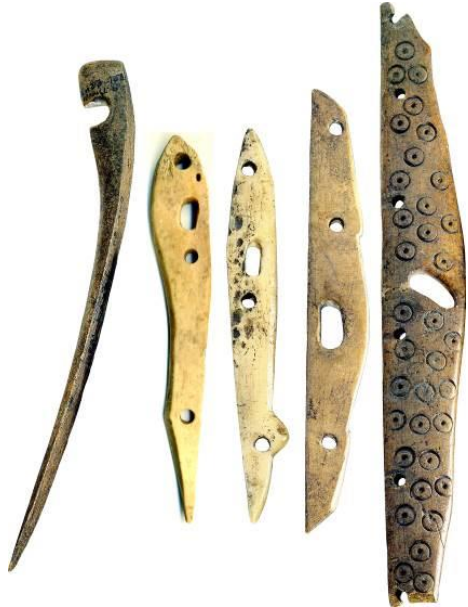
Resim 3: Okçu teçhizatından detaylar. Kemik Bilyar Yerleşimi.

Kıpçakların tarihi süreçte Orta İdil bölgesindeki rolleri, Altınordu döneminde, İdil Bulgarları ve Aşağı İdil'in (Deşt-i Kıpçak) bozkır kavimleri Moğolların kurduğu devletin hâkimiyetine girince daha da artmıştır. Günümüz Tatarlarının maddi ve manevi kültürlerinin bu oluşuma katkıları arkeolojik buluntular açısından henüz yeterince araştırılmamıştır. Fakat yazılı ve dilsel kaynaklar, Altınordu dönemini Tatarların etnosunun ve kültürlerinin oluşumu açısından önemli bir etap olarak kabul eden tarihçiler grubunun görüşlerini desteklemektedir. Bu süreçlerde bize göre yabancı "Tatar" gruplar değil, Bulgar ve Kıpçak grupları lider konumdaydılar.