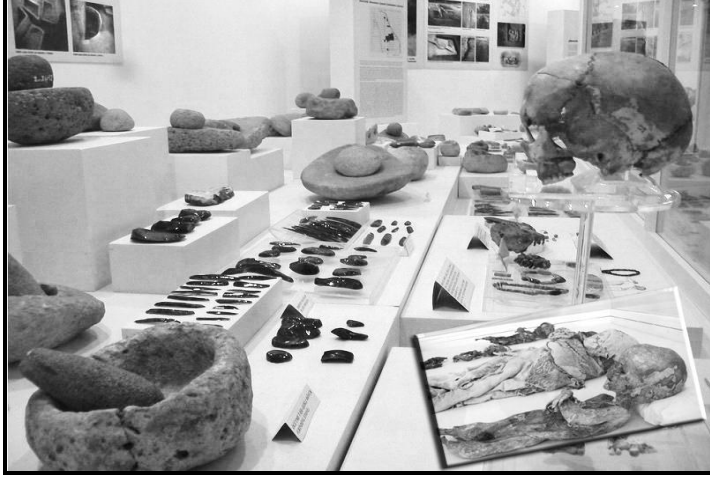
Aksaray Müzesinden bir kesit, (Foto.: Savaş Ulukaya)

İslami dönem öncesi sürecinde Aksaray ve çevresi özellikle Hristiyanlık açısından çok önemli bilgi ve kalıntılar barındırmaktadır. Hristiyanlık öncesi Roma İmparatorluğunun baskıları altında yaşam savaşı veren hristiyan unsurların bölgenin tabii korunaklı vadi ve yumuşak volkanik kayalar içerisinde oluşturdukları barınaklarda gizlendikleri kabul edilmektedir. Romanın hristiyanlığı kabul ettiği dönemlerden itibaren ise hristiyanlar rahatlamış ve bölgede uzun yıllar yaşamlarını sürdürmüşlerdir. İslami dönemde de bu tabii korunaklı yerleşim yerlerinin kullanılmaya devam edildiği anlaşılmaktadır.