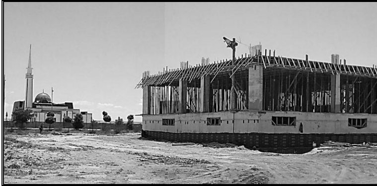
Fakülte binamızın inşaatı. 17.06.2014