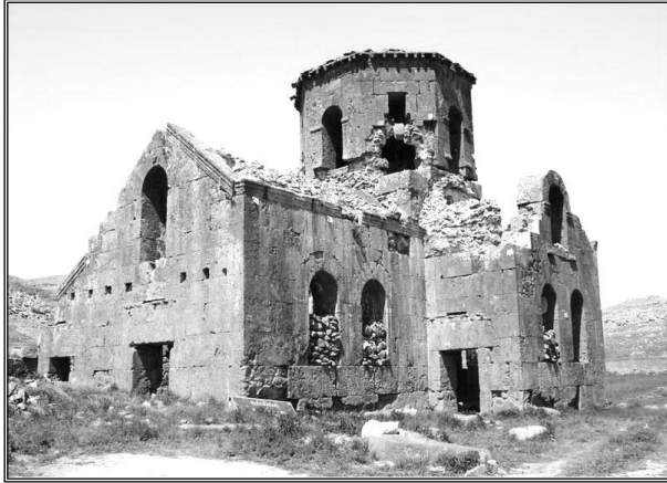
Kızıl Kilise, (Foto.: Savaş Ulukaya)

Aksaray'ın ilçelerinden eski ismiyle Karballa ve Gelveri yeni ismiyle Güzelyurt bu açıdan çok önemli ve