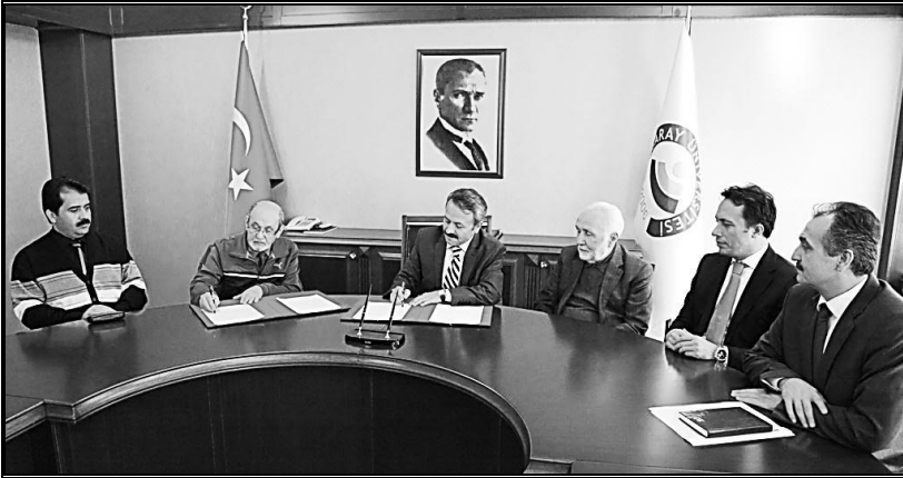
Fakülte inşaatı protokol imza töreni. 16

Bu arada Sayın Rektör Prof.Dr. Mustafa Acar Bey'in kampüs içerisinde yeni yapılan Merkezi Derslikler binasında geçici de olsa Fakültemize yer açmasını şükranla ve takdirle anmam gerekir. Bu esnada yine Rektör Bey'in teklifiyle inşası düşünülen İslami İlimler Binası projesinde bulunması gerekenler ve ihtiyaçlar çerçevesinde bilgi talep edildi. Konya İlahiyat Fakültesinde Dekan Yardımcılığım döneminde inşa edilecek bina için yaptığımız hazırlıklar çerçevesinde elimizde hazır bulunan proje ihtiyaçları ve derslik, öğretim elemanları odaları ve diğer unsurları revize ederek sundum. Bu teklifte farklı büyüklüklerde 38 derslik, 60 öğretim elemanı odası, idare bölümü, toplantı odaları, 2 anfi, kütüphane, konferans salonu, kantin, sosyal ve kültürel faaliyet alanları ile diğer ihtiyaçların bulunduğu bodrum+3kattan oluşan toplam 9000m 2 'lik bir bina tasarlanmıştı. Bu ihtiyaçlar çerçevesinde proje ihale edilip hazırlandı. Bu çapta bir yapı 40-50 yıl hizmet edebilecek bir fiziki ihtiyacı karşılayacak çerçeveydi.