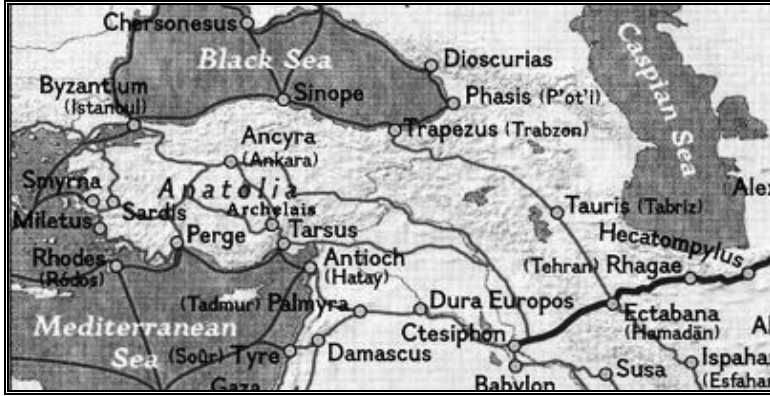
Tarihi ticaret yolları güzergahı ve Aksaray

bakir özellikler taşımaktadır. Bu ilçenin merkezinde yer alan 5,5 km. uzunluğundaki Manastır Vadisi kayalardan oyularak yapılmış kilise, şapel ve yer altı şehirlerini barındıran adeta bir tarih hazinesidir. Güzelyurt ve çevresinde bundan başka tarihi değeri yüksek dini yapılar vardır. Aziz Gregorius Church (Cami Kilise) Kapadokya bölgesinin en eski kilisesidir. Sivrihisar köyü yakınlarında bulunan Red Church (Kızıl Kilise) mimari açıdan ilkleri barındırmasıyla dikkatleri üzerine çekmektedir. Yine tabii kayalıklar üzerine inşa edilmiş Analipsis Church (Yüksek Kilitse) ve Monastery Valley'de (Manastır Vadisi) kayalardan oyularak yapılmış Sivişli kilise otantik özellikleriyle bu güne kadar varlıklarını sürdürebilmiş nadir eserlerdir. Diğer taraftan Aksaray'a 30 km. uzaklıktaki dünyanın ikinci büyük kanyonu olan İhlara Vadisi içerisinde kayalardan oyularak yapılan çok sayıdaki kilise bölgenin Hristiyanlık tarihi açısından önemini ve sahip olduğu turizm potansiyelini göstermesi açısından oldukça önemlidir. 6 Bütün bu tarihi ve beşeri coğrafya kalıntıları, araştırılmak ve incelenmek için bilim insanlarını beklemektedir. Yapılacak bilimsel tespitler bölgenin ve Aksaray'ın potansiyel tarihi ve kültürel değerine katkı sağlayacaktır. 7