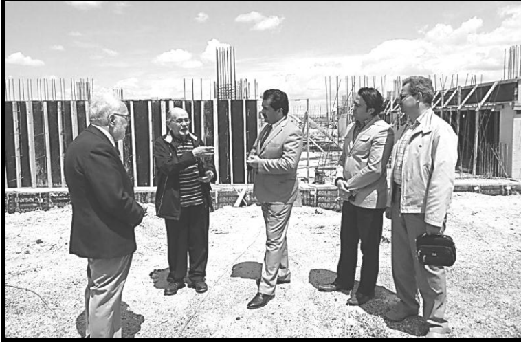
Fakülte binamızın inşaatı. 20.05.2014 17